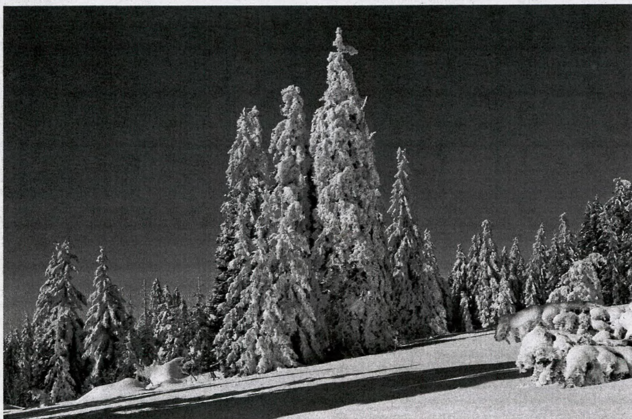
Jetzt ist sie da, die weiße Pracht.