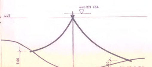
SCHNITT D - D