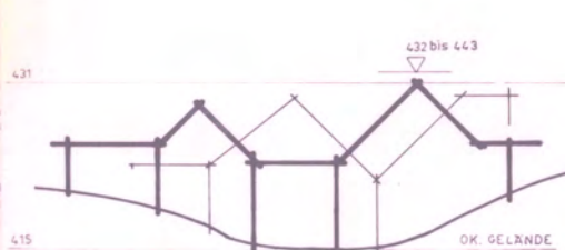
SCHNITT B - B