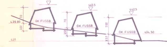
SCHNITT A - A