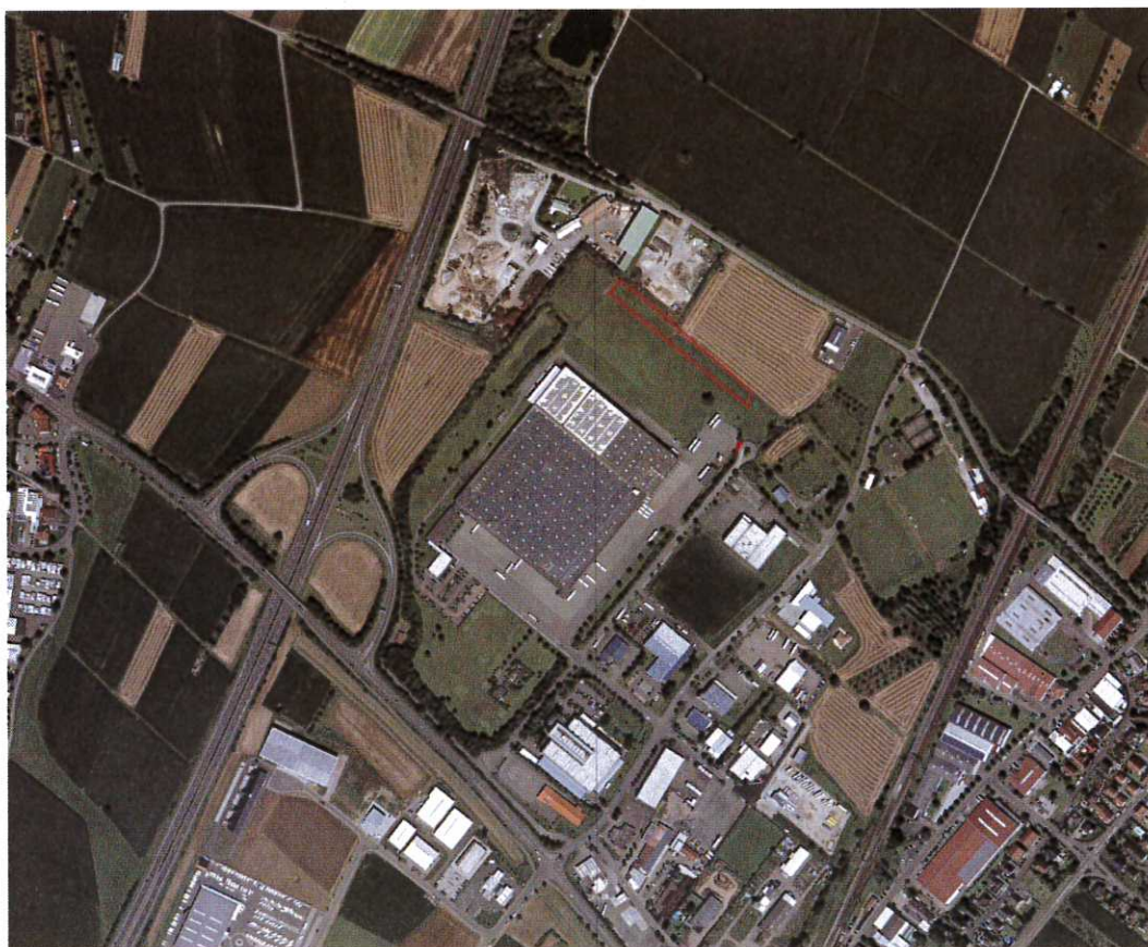
Abbildung 2: Abgrenzung des neuen Änderungsbereiches