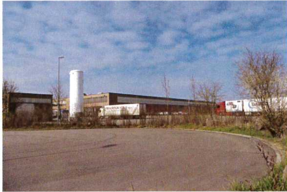
Abbildung 1: Geplanter Zufahrtsbereich am Wendehammer im nordöstlichen Bereich