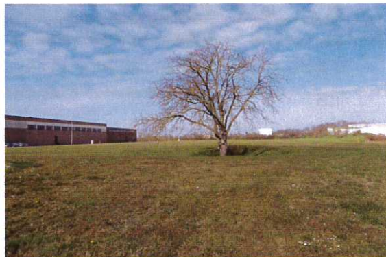
Abbildung 3: Markanter Einzelbaum im bereits überbaubaren Bereich des alten B-Plans "Mittel-Lachenfeld/Aldi"