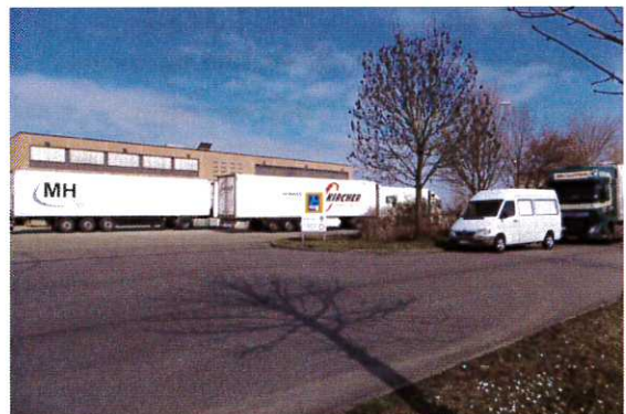
Abbildung 4: Aldi-Gelände von Osten