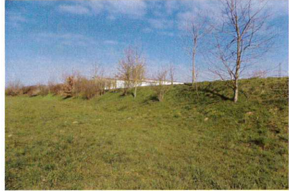
Abbildung 2: Böschung mit einzelnen Bäumen im nördlichen Teil des Änderungsbereiches