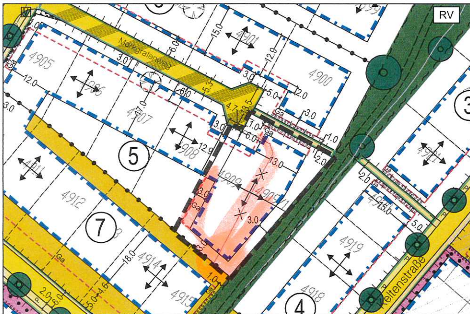
Änderung der Planung 12.07.2010 / M 1:1000